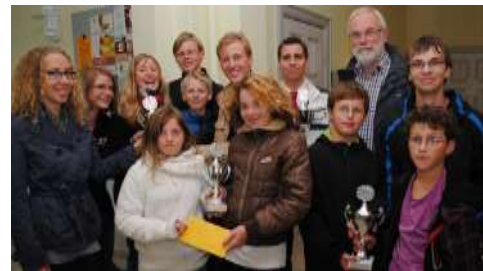
Siegerehrung in Meldorf

In Meldorf machten fast 500 RadlerInnen mit. Davon etwa die Hälfte SchülerInnen. Insgesamt wurden von 20 Teams 76.871 km erradelt. Das reichte für Meldorf in der Kategorie „meiste Kilometer pro EinwohnerIn“ zum 1. Platz . Dies ist umso beachtlicher, da insgesamt 160 Städte antraten – 100 mehr als 2011.