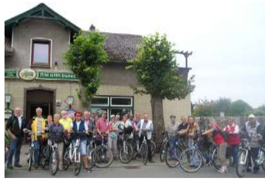
Tour nach Nordhastedt

in Höhe von 1000 €. Ein kleines Team fuhr zum Bundesfinale nach Berlin. Zwar war das Projekt nicht unter den ersten drei Bundessiegern, aber die Präsenz in Berlin und der Austausch mit den anderen Projektträgern war sehr interessant und beeindruckend. Der Landessieg ist eine großartige Wertschätzung der ehrenamtlichen Arbeit und macht Meldorf weit über die Grenzen Dithmarschens hinaus bekannt.